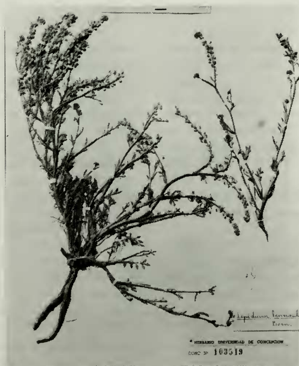
FIG. 2. Lepidium philippianum . Teillier y González s/n. La Parva (SGO).